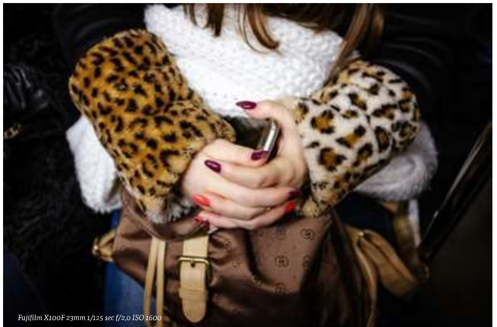
Fujifilm X100F 23mm 1/125 sec f/2,0 ISO 1600