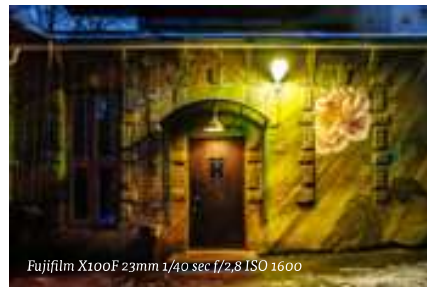
Fujifilm X100F 23mm 1/40 sec f/2,8 ISO 1600