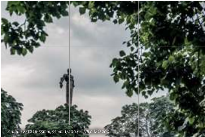
Gebruik de regel van derden om een foto rustiger om naar te kijken te maken.