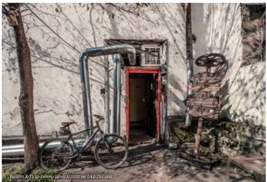
Fujifilm X-T2 10-24mm - 11mm 1/2000 sec f/4.0 ISO 200