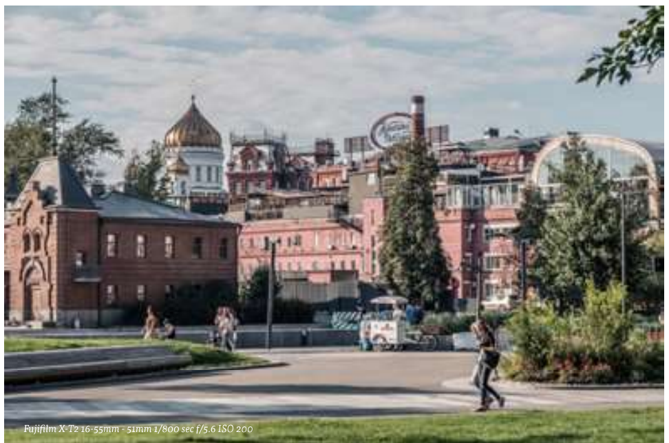
Fujifilm X-T2 16-55mm - 51mm 1/800 sec f/5,6 ISO 200

LINKS - Het terrein van Krasny Oktjabr is ook een ideale plaats voor avondfotografie.