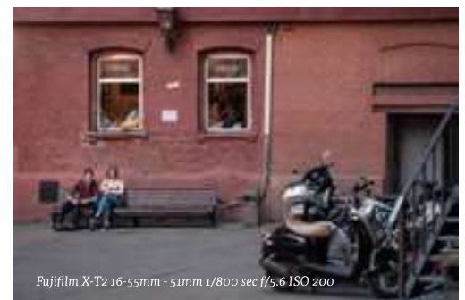
Fujifilm X-T2 16-55mm - 51mm 1/800 sec f/5,6 ISO 200

BOVEN - De voormalige chocoladefabriek biedt genoeg interessante bedrijvigheid om uren rond te hangen met je camera tussen het jonge volk.