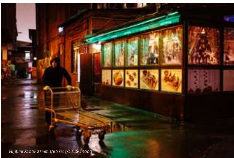
Fujifilm X100F 23mm 1/60 sec f/2,5 ISO 5000

Zoals in elke grote moderne stad zijn industriële panden omgebouwd tot hippe alternatieve plekken. Veel sites zijn op het nippertje gered van de sloophamer en omgetoverd tot oases van rust midden in de hectische stad. Jonge moderne Russen komen hier werken,