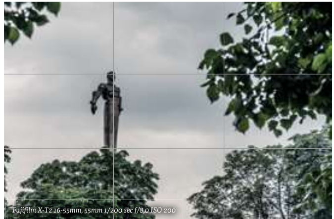
Fujifilm X-T2 16-55mm, 55mm 1/200 sec f/8.0 ISO 200

je je foto's erg kan verbeteren. Probeer bij een wijds beeld steeds iets op de voorgrond te hebben om diepte te creëren. Maar kijk vooral goed rond. Absurdistan is overal en hoe meer