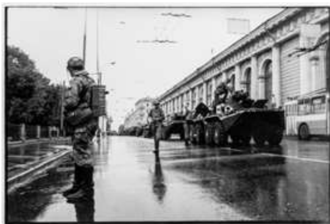
Augustus 1991. Tanks in de straten rond het Rode Plein tijdens de poging tot staatsgreep op Gorbatsov.

M oskou is een stad van extremen. Oud en nieuw wisselen elkaar voortdurend af. Je komt in de wereld van de bojaren en de tsaren. Van Dostojevski, Poesjkin en Tolstoj. Van Tsjajkovski en Rachmaninov. Van de Bolsjewieken en de Mensjewieken. Van de revolutie en het communisme. En natuurlijk ook van wodka en kaviaar. Vooral de laatste jaren heeft de metropool in korte tijd een hele metamorfose ondergaan. Tijdens mijn eerste bezoek in 1991 maakte ik kennis met een grauwe, grijze, kille en onvriendelijke Sovjet-stad. Bovendien werd ik meteen die eerste keer getraakteerd op tanks in het straatbeeld tijdens de korte staatsgreep in augustus van dat jaar. Het plaatje werd hierdoor nog complexer dan wat ik al in mijn hoofd had. Dat was het begin van de val van de Sovjet-Unie. Elke keer als ik er nadien terug-