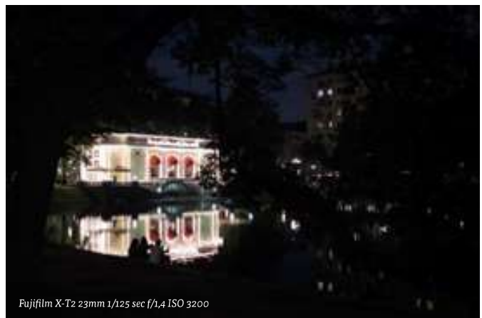
Fujifilm X-T2 23mm 1/125 sec f/1.4 ISO 3200

Gebruik licht en donker, spiegeling en vlakverdeling om foto's spannender te maken en diepte te geven.