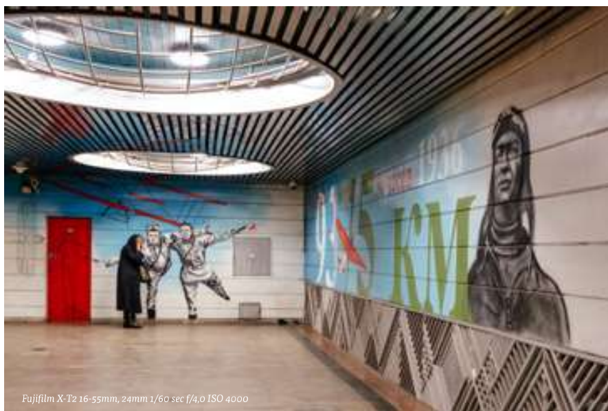
Fujifilm X-T2 16-55mm, 24mm 1/60 sec f/4,0 ISO 4000

dakterrassen met zicht op de rivier en op de kathedraal. Op de binnenkoer is er in de zomer altijd wel een of andere voorstelling of film te zien. Hoe dieper je de fabriek induikt, hoe meer je tegenkomt. Achter de hoge fabrieksmuren zitten galleries, redacties van kritische media, een fototentoonstellingsruimte met café en een bibliotheek verborgen. Ook Vinzavod, een voormalige bierbrouwerij, mouterij en wijnfabriek is een plek geworden waar kunstgalerijen welig tieren met een waaiër aan kritische maar evengoed extreem behoudsgezinde kunst. De vele graffiti en excentrieke jongeren vormen een gedroomd decor voor de straatfotograaf. Een derde plek waar ik graag ronddoel in de late uurtjes is de oudste buurt van Moskou. Je loopt er je door kleine steegjes en pleintjes, waar street-art je op elke hoek verrast. Ook hier hebben alternatieve zaken de buurt ingepalmd.