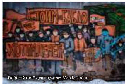
Fujifilm X100F 23mm 1/40 sec f/2,8 ISO 1600

Moskou is zoveel meer dan het Rode Plein, het Kremlin, kloosters en kerken. Het is een stad die zich niet zomaar laat kennen, je moet er moeite voor doen. Veel boeiende plekken staan niet in de reisgidsen vermeld. Met een goede voorbereiding kan je er zelf naar op zoek. Op Youtube zijn hele interessante video's te vinden die je het andere Moskou