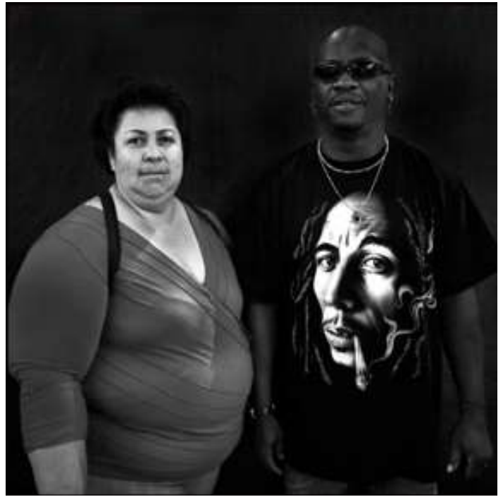
Mensen vriendelijk benaderen levert meestal een foto op.