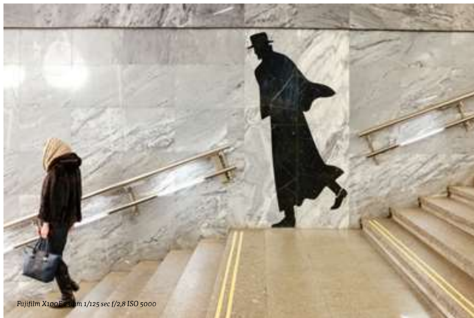
ONDER - Soms is het juist wachten tot het moment zich aandient.

Op aanraden van een collega heb ik toen een kleine compacte Fuji X100F gekocht en ben hiermee vertrokken. Ik voelde me wel erg licht bepakt voor een fotoreis, maar man, wat een toestel. Deze kleinood heeft dezelfde sensor als zijn grote broer waarmee ik voordien werkte. Het toestel heeft een vaste 23mm-lens, waarmee ik ook al werkte. Alleen past deze in mijn vestzak. Hiermee kwam ik al helemaal over als een toerist, waardoor mensen zich nog minder van je aantrekken en toelaten dicht in hun omgeving te komen. Sindsdien ga ik enkel nog met deze kleine camera op reis.