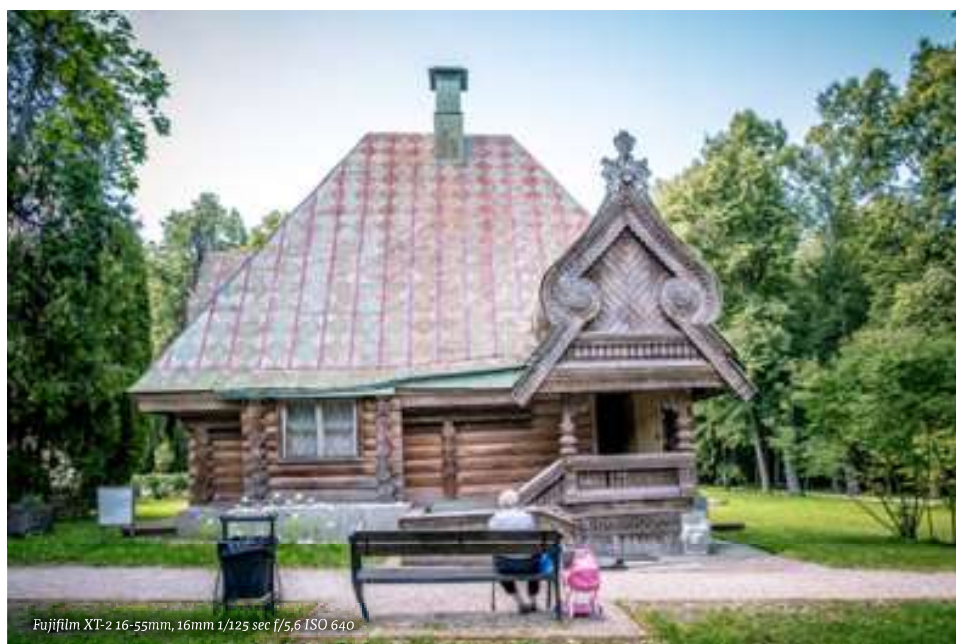
BOVEN - Wees snel, omdat een absurde situatie als deze spoedig een illusie kan blijken.

De overstap van een fullframe spiegelreflex-camera naar een systeemcamera maakte een groot verschil in grootte en gewicht van zowel toestel als van de lenzen. Op een gegeven moment werd al mijn fotomateriaal gestolen. Dat gebeurde twee dagen voor een geplande reis naar Moskou. Ik had helemaal niets meer om mee te fotograferen en ik was een fortuin kwijt.