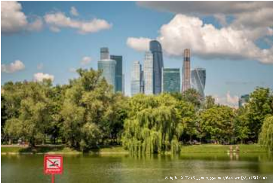
Fujifilm X-T2 16-55mm, 55mm 1/640 sec f/8,0 ISO 200

Het ene moment waan je je in de middeleeuwen. En het andere kom je in de wereld van hypermoderne architectuur, exclusieve winkels en galerijen. Dat maakt de stad net zo boeiend.