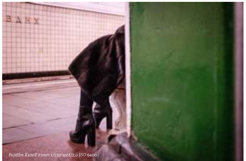
Fujifilm X100F 23mm 1/250 sec f/2,0 ISO 6400

ONDER - Zet een systeemcamera op stil en je kunt mensen fotograferen zonder dat ze het doorhebben.