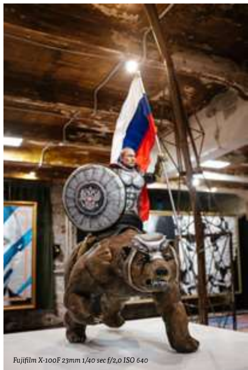
Fujifilm X-100F 23mm 1/40 sec f/2,0 ISO 640

Putin op een beer in de tentoonstelling 'SuperPutin' in Vinzavod, waar de leider op de meeste onwaarschijnlijke manieren verheerlijkt wordt.